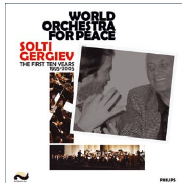
CD + DVD, Philips 475 6937