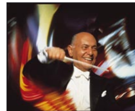
Sir Georg Solti 1912-1997