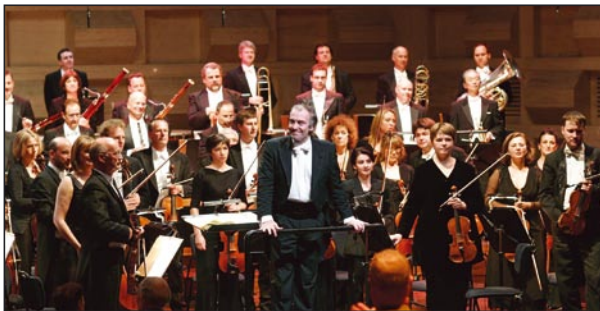
At the Gergiev Festival, Rotterdam in the presence of HM Queen Beatrix 8th September 2007