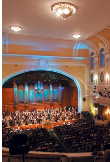
At the Great Hall of the Moscow Conservatoire, 30 August 2005