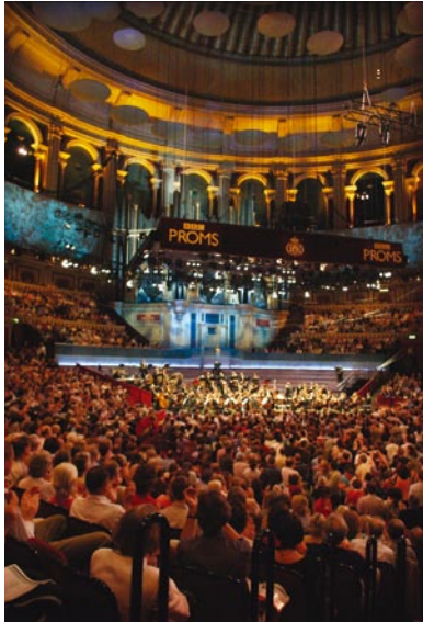
At the BBC Proms, Royal Albert Hall London, 27 August 2005